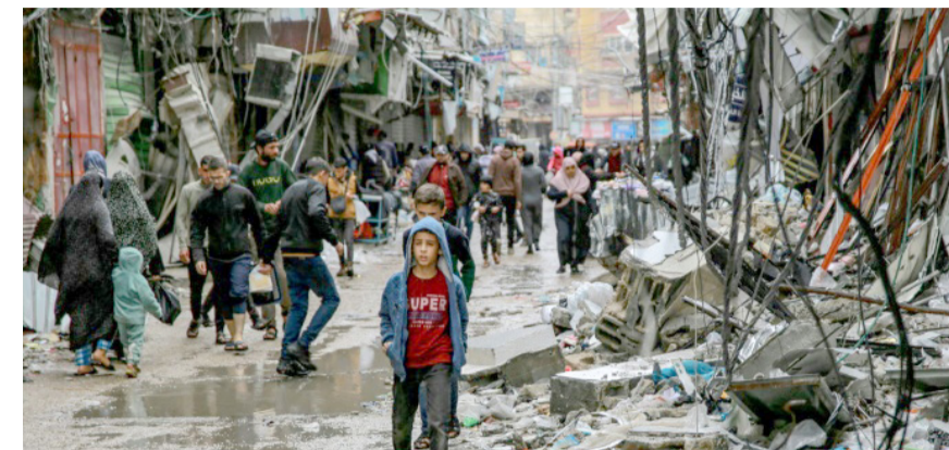
انقاص : فلسطينيون يسرون وسط انقاص أبنية دمرت في ضربات إسرائيلية قرب سوق الزاوية في غزة

إسرائيليين و30 أسيراً فلسطينياً في اليوم الخامس للهدنة بدون عقبات)، مشيراً إلى أن (التبادل يشمل أيضاً عدداً من المعتقلين والمعتقلات المحتجزين في غزة). ومددت الهدنة بين إسرائيل وحماس أمس، للسماح بالإفراج عن مزيد من الرهائن الإسرائيليين والمعتقلين الفلسطينيين وإيصال المساعدات إلى غزة حيث لا يزال الوضع الإنساني كارثياً. ويبدأ سريان اتفاق الهدنة الجمعة الماضية، بعد وساطة قطرية بدعم من مصر والولايات المتحدة وسمح حتى الآن بالإفراج عن 50 رهينة محتجزين في قطاع غزة و150 فلسطينياً من السجن الإسرائيلى. وأفرج كذلك عن