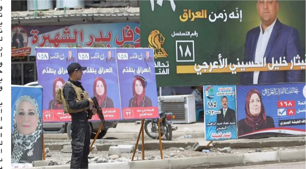
دعائية: لافتات الدعائية الانتخابية في الموصل

مدينة الموصل بالكثير من اللافتات والبوسترات الانتخابية الخاصة بالمرشحين مما دعا اهالي الموصل لاستيحاء الظاهرة التي انارت الكثير من الاراء خصوصا بنشان