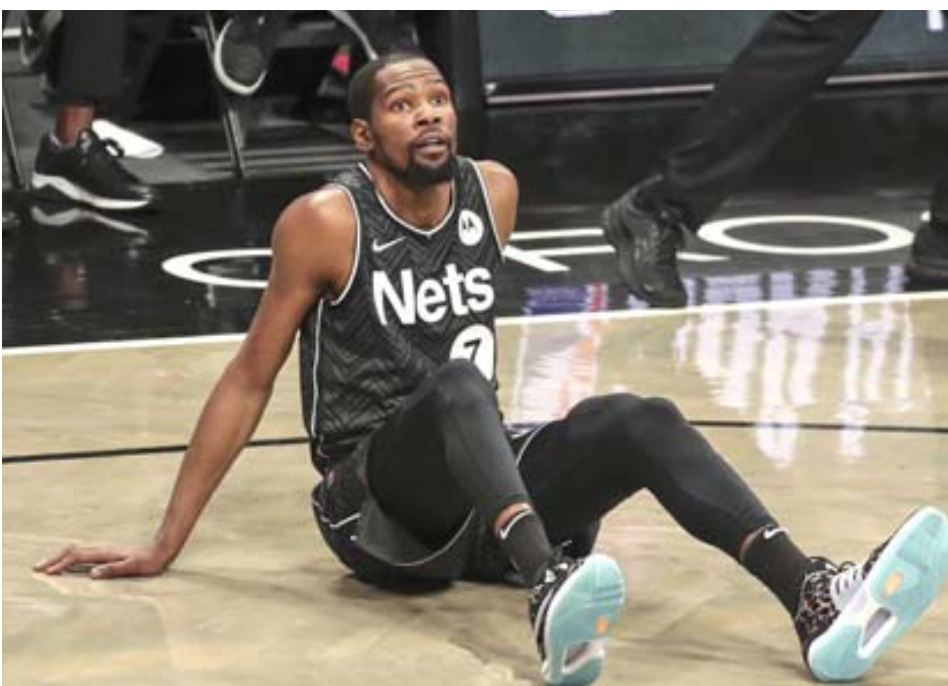
عملاق : كيفن دورانت عملاق بروكلين نتس في أحد مباريات فريقه

□ عمان- وكالات: أعلن نادي الوحدات الأردني، أمس، عن القائمة الأولية للاعبين فريق كرة السلة، الذين سيمثلون في المسابقات المحلية هذا الموسم. ووفقا للموقع الرسمي للوحدات، تم التعاقد مع لاعبين يتمتعون بالخبرة الدولية من أمثال: محمود عابدين ومحمد شاهر وهاني الفرج وعمار بسطامي وعلي الزعبي ومحمد الشامي ويوسف أبو وزنة وموسى مطلق وأحمد الخليل. لبشكوا القائمة الأولية للفريق. ويطمح الوحدات لاستعادة لقب دوري المحترفين الأردني، الذي توج به لأول مرة في الموسم قبل الماضي. وكان الوحدات قد تعاقد قبل عدة أسابيع مع المدرب، معتصم سلامة، ليتسلم مهمة المدير الفني. وغاب فريق سلة الوحدات في الموسم الماضي عن منصة التتويج، رغم تعاقدته مع عدد من اللاعبين المميزين. وقال كيفن دورانت عملاق بروكلين نتس إنه لا يزال يتصور أن زميله كايي إيرفينج سيلعب دورا مهما مع فريقه هذا الموسم رغم