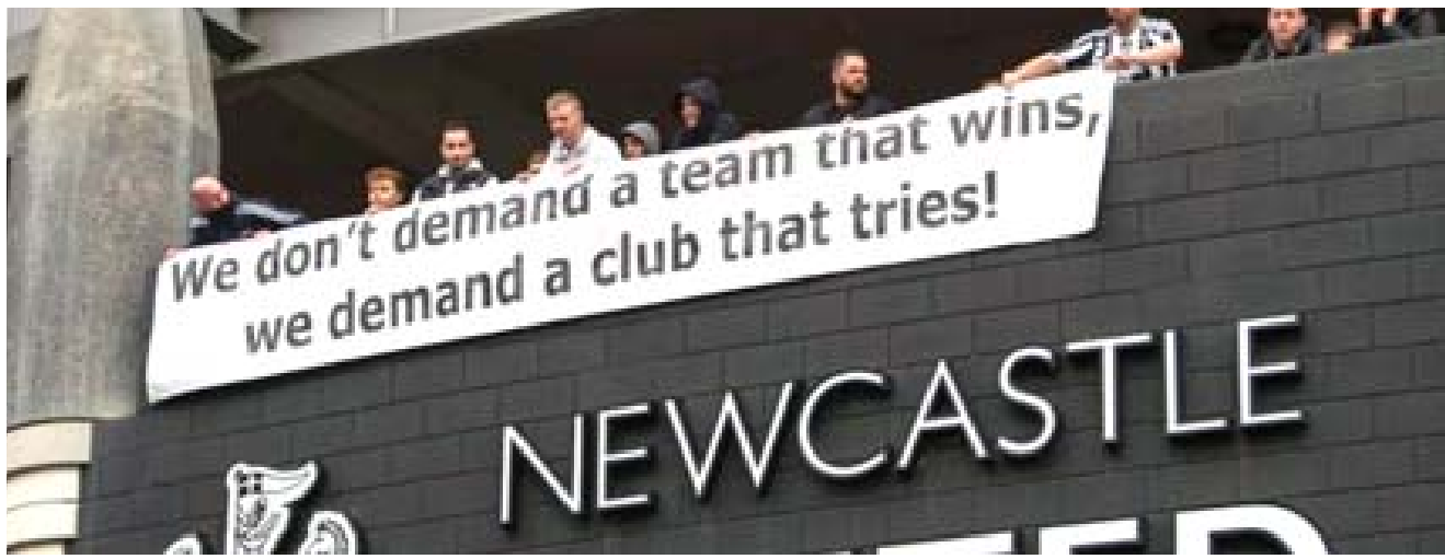
لافتات : مجتمعون يرفعون لافتات فوق مبنى النادي

حسابات البعض على تويتر وتداول آخرون فيديوهات لرقصة العرضة السعودية. وبدأ البعض بكتابة لائحة من المتطلبات التي يتخون أن يرونها في النادي، كملعب جديد وصفقات لاعبين من العيار الثقيل. والمتفقون راوا أن فرحة جماهير نيوكاسل بان سيرحل قريباً، قد تكون مبررة، لكن حسابات البعض لإنتهاكات حقوق الإنسان المزعومة من قبل المملكة العربية السعودية مخيف حقاً. كعبارة رياضية، هو موجود من أجل البقاء لا أكثر.