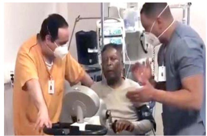
الأسطورة بيليه يجري التمارين الرياضية استعداداً لمغادرة المستشفى

□ ساو باولو- (أ ف ب) - نشر أسطورة كرة القدم البرازيلية بيليه بحسب الفكاهي المعتاد مقطع فيديو الثلاثاء يظهر فيه وهو يجري التمارين ويأمل مغادرة المستشفى.