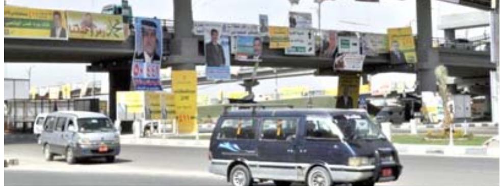
دعاية : شوارع رئيسة تكثف بدعايات المرشحين للإنتخابات

فقدان موظف عقد تابع لها في بغداد وقالت المحدث باسم المفوضية جماعة الغلاي في تصريح إن (الموظف المفقود يعمل بصفة عقد تم اعتقاله من قبل الجهات الأمنية بتهمة خاصة به