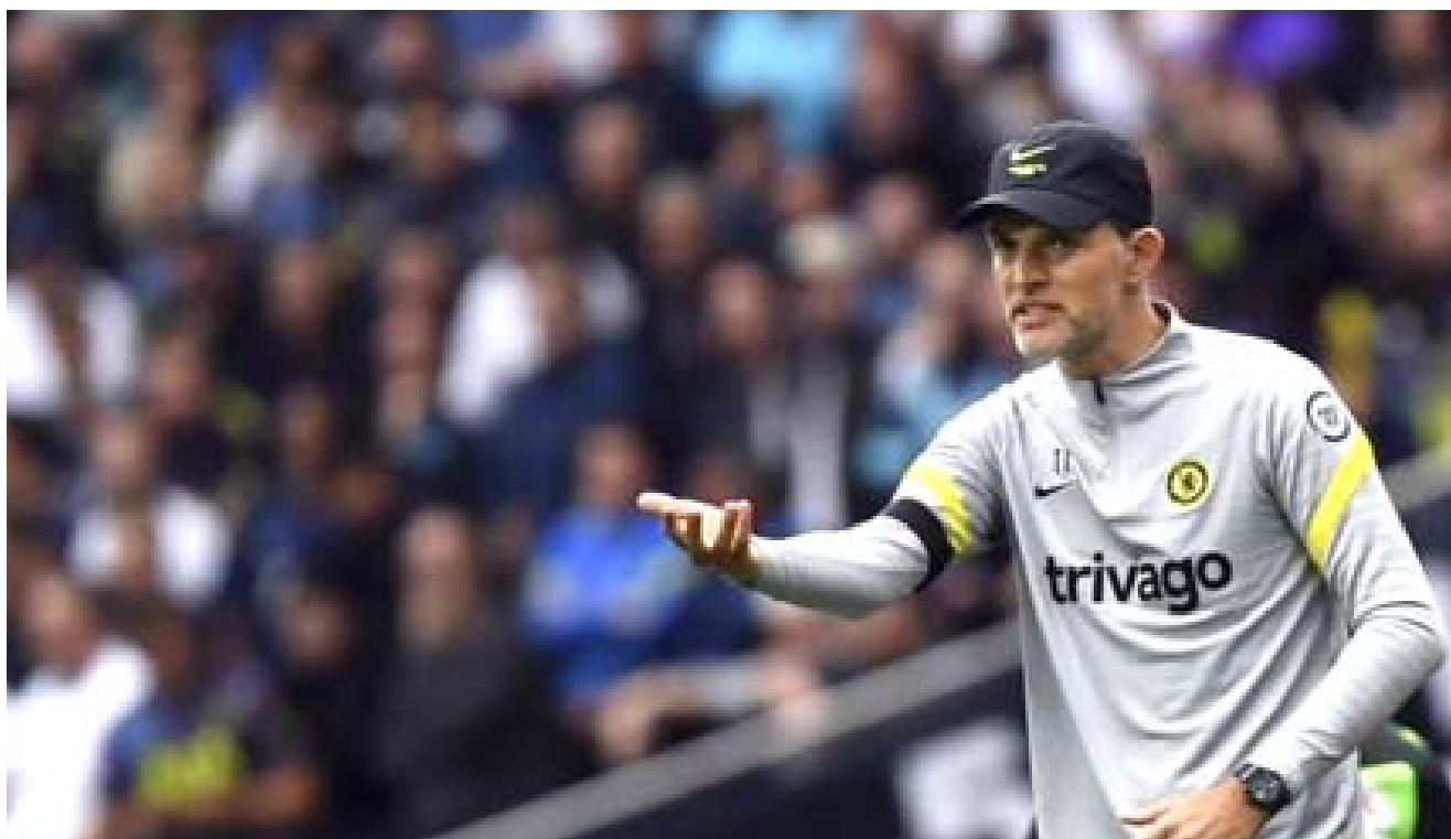
توجيه: توماس توخيل المدير الفني لنادي تشيلسي يقوم بتوجيه لاعبيه في إحدى مباريات الدوري الإنكليزي

لندن- الزمان قال لاعب كرة القدم السابق الآن شيرر، أنه ما يزال الدوري الإنكليزي في مراحلها الأولى، ولكن فريق تشيلسي يبدو مصمماً على التتويج باللقب، وغير مستعد للتنازل عنه بسهولة. فقد أبهر انشبال، توماس توخيل، الجمهور بادائهم منذ بداية الموسم، مستعربين على النهج الذي رسمه لهم المدرب الألماني، فحتى عندما لا يلعبون بطريقة جيدة أو عندما يقعون في أخطاء مقلما حدث مع المدافع ريس جيمس حين طرد الشهر الماضي، فإن الفريق يدي صرامة ومقاومة لا تمكن زرعتهما. فقد فاز تشيلسي على توتنهام بثلاثة أهداف دون رد، وأثبت أنه فريق قوي يقوده مدرب ممتاز فقد أقدم توخيل لاعبه نغولو كانتي في الشوط الثاني مكان، ميسن ماونت، بهدف السيطرة على خط الوسط وأفسح المجال للمدافع ماركويس بونسو بالتقدم على الجناح وكان تشيلسي يهاجم على الجناحين في الشوط الأول، ولكن الهجمات تخففت في الشوط الثاني وحدثت دفاع توتنهام تماماً. وأحكم تشيلسي بذلك سيطرته على كامل مجريات اللعب، وبعدما سجل الهدف الأول، اقتصر توتنهام على تخفيف الأضرار. وكانت المباراة أن تنتهي بدوري إبطال أوروبا من دونه، ولكنه أصبح دون شك فريقاً متكاملًا بفضل، كما أن الفريق اللندني يملك قوة في العمق أيضاً والدليل على قوة الفريق الهائلة أنه أقدم لاعبا في الدقائق الأخيرة من المباراة، ولكنهما استعادا اعتبارهما في مواجهة لندن، وأظهر سولشاير الكرة قبل تسديد الضربة، كما أنه لم يجر عملية الإحماء، وأعرف أن له سجلاً ممتازاً في تنفيذ ضربات الجزاء ولكن كانت تلك مقامرة من مورين، لم يفلح فيها. وبدأ ليفربول مشواره بطريقة رائعة أثارت إعجابي فعلاً. وعكس منافسته على اللقب لم يتعاقد الفريق