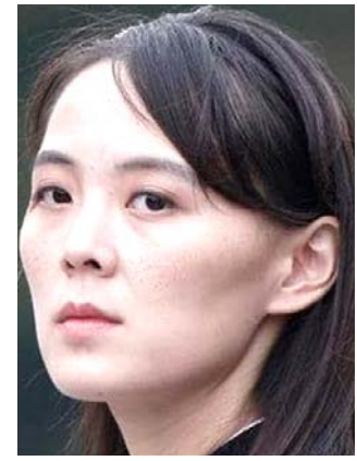
كيم يو جونغ

في كلمة له أمام الجمعية العامة للأمم المتحدة في وقت سابق هذا الأسبوع، اقترح مون إعلان نهاية النزاع الذي تجرّج قبل 71 عاماً، مشدداً على أن شأن خطوة كذلك أن تحقق تقدماً لا يمكن الرجوع عنه في عملية نزع السلاح النووي ويهدد لحقة من السلام العالمي. وقالت إن اقتراح الإعلان رسمياً عن انتهاء الحرب فكرة 'مجنونة' لكنها شددت أن على كوريا الجنوبية أن تخلى عن سلوكها العدائي أولاً.