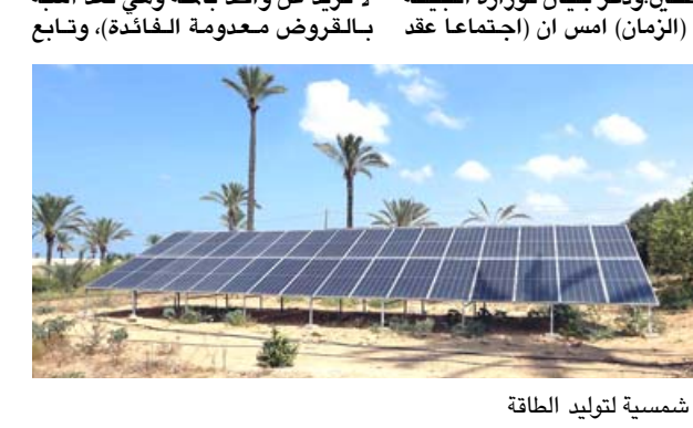
خلايا شمسية لتوليد الطاقة

استعملت اللجنة الوطنية الخاصة بمبادرة البنك المركزي العراقي للمواصفات المنهجية بشأن منح