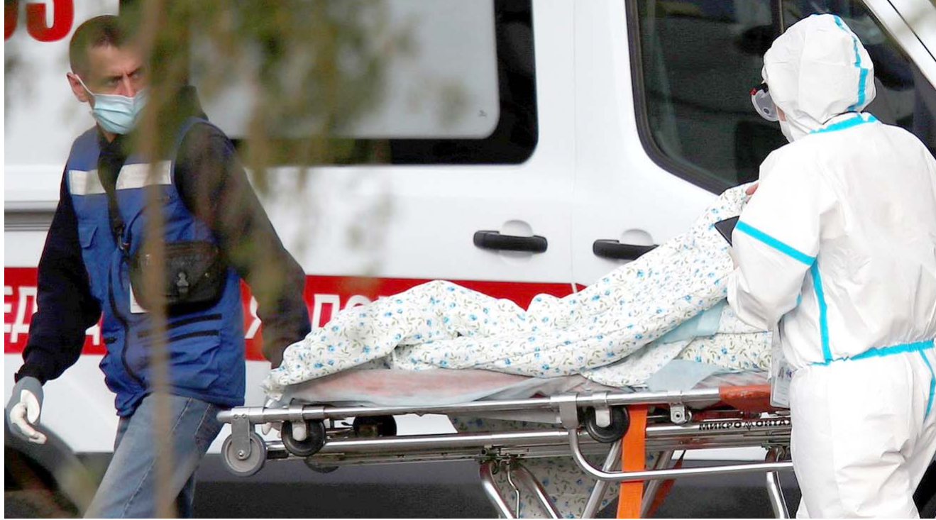
وفيات: سجلت روسيا أمس الجمعة أعلى حصيلة وفيات يومية بفيروس كورونا بلغت 828

وكالة الدواء الأوروبية تبت بمسألة الجرعات المعززة ضد كورونا