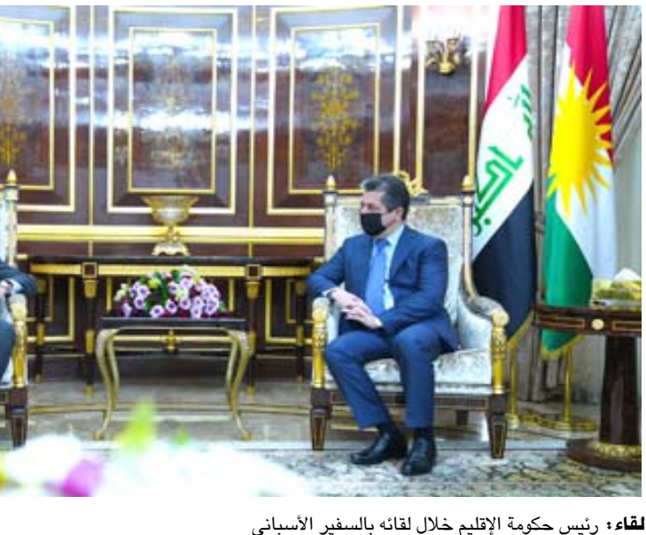
لقاء : رئيس حكومة الأقليم خلال لقائه بالسفير الأسباني

انتهت بالخروج على آثار ترجع إلى أوائل حدة أوروك التي بدأت في منتصف الألفية الرابعة قبل الميلاد منذ