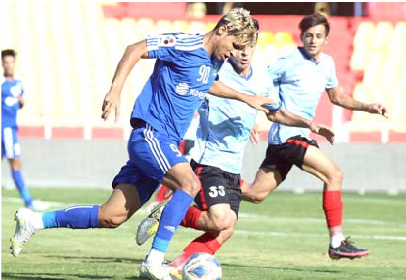
صراع؛ يشتد الصراع مبكراً في مواجهات الممتاز

الى ملعب الديوانية الاحد المقبل في وقت لا يمكن التقليل من اداء الصناعة الذي قدم ما عليه بعد العودة لمقعد في المباراة التي افتتحه في مواجهة قوية امام احد المنافسين على القاب. مباريات السبت وتجري السبت المقبل خمس مباريات في افتتاح الجولة الثانية وفيها يضيف سامراء الجوية ويخرج الكرخ الى زاخو ويستقبل نور وز النطف ويلتقي القاسم والصناعة ويتواجه نطف ميسان و الوسط.