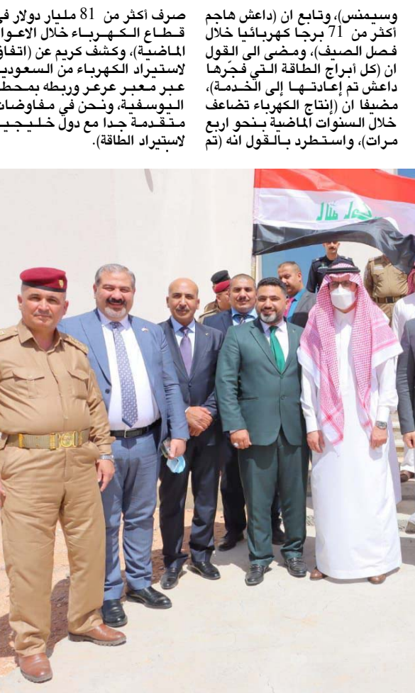
توسيع : اعضاء اللجنة العراقية السعودية تبحث توسيع المنافذ بين البلدين

محافظة السلمانية. وقال بيان تلحقته (الزمان) امس انه (بحسب توجيهات المراجع العليا بتأمين تكثيف الجهد الاستخباراتي للملاحقة العناصر الارهابية الهاربة، حيث استطاعت مفاز مديرية سيرة استخبارات وأمن السلمانية التابعة الى المديرية العامة للاستخبارات والأمن وبالتنسيق مع مديرية اسايش السلمانية عن إلقاء القبض على خمسة عناصر ارهابية، وذلك من خلال وجودهم بالمحافظة). مينا (المتمهمين صادرة بحقهم مذكرات قبض وفق احكام المادة اربعة ازرها من محكمة تحقيق كربلاء، وانه تم القبض عليهم عبر معلومات استخباراتية دقيقة من مديرية استخبارات وأمن (بايل). وتمكنت مفاز معالجة القبائل غير المنغلقة في مديرية