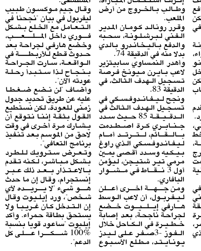
مباراة، جانب من مباراة بايرن ميونخ وبرشلونة

ومر جنابري ببينة حريرية في عمق دفاع برشلونة، في الدقيقة 72 وصلت لجوريتسكا الذي سد الكرة ضعيفة حين اخضان تير شتيجن حارس البارسا. واشتكى البنا من إصابة عضلية، لم يستطع على إثرها استكمال المباراة، وطالب بالخروج من أرض الملعب. وقرر رونالد كومان المدير الفني لبرشلونة، سحبه بدلا منه في الدقيقة 74، واهدر النمساوي سابيتزير لاعب بايرن ميونخ فرصة تسجيل الهدف الثالث، في الدقيقة 83. ونجح ليفاندوفسكي في تسجيل الهدف الثالث في الدقيقة 85 حيث سد جنابري كرة اصطلدت باللقائم، لتترند أمام ليفاندوفسكي الذي راوغ بيكيه وسدد أقصى يمين مرمى تير شتيجن، ليؤمن أول 3 نقاط في مشوار البافاري. ومن جهة اخرى اعلن ليفيربول، ان لاعب الوسط هارفي إيليوث خضع لجراحة ناجحة، بعد إصابة خطيرة في الكاحل خلال الفوز 3-صفر على ليند يونائيد، مطلع الأسبوع