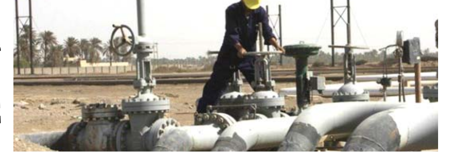
نفط : حقل نفطي في البصرة

واصدرت الهيئة الوطنية للاستثمار توجيهاً بشأن بيع شقق بسمية والآلية المتبعة مع المصارف . وقالت الهيئة في بيان تلقتّه (الزمان) امس أنه (استناداً الى توجيهات رئيس الهيئة