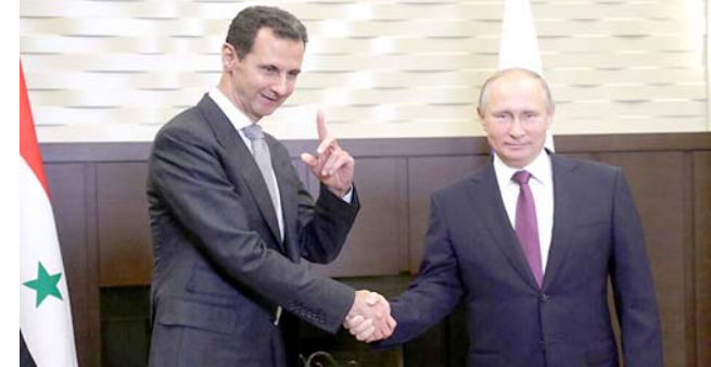
استقبال: الرئيس الروسي بوتين خلال استقبال نظيره السوري بشار الأسد

موسكو) ١٠ أ ب - أعلن الكرملين امس الثلاثاء أن الرئيس فلاديمير بوتين بصحة ممتازة بعد الكشف عن مخالطته شخصاً مصاباً بفيروس كورونا. وقال المتحدث باسم الكرملين