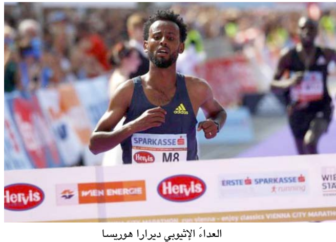
العداء الإثيوبي دبيرارا هوريسا

مديره- وكالات استبعد منظمو ماراثون فيينا العداء الإثيوبي دبيرارا هوريسا، الفائز في أول سباق تقيمه مدينة كبرى في أوروبا منذ جائحة كورونا، وبحسب وسائل إعلام فقد تم إلغاء السباق ذلك بعد ان اكتشفت الجهة المنظمة ارتداء العداء حذاء ذا نعل أكبر سمكاً مما هو مخصص عليه في معايير السباق. وأضافت الوكالة، انه تم إلغاء نتيجة العداء الإثيوبي الذي أنهى السباق متفوقاً على زميله المتسابق الكيني ليونارد لانغات بفارق ثلاث فوان فقط.