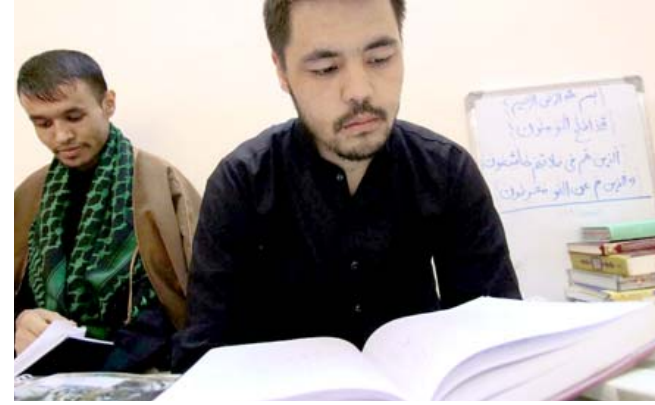
حوزة: طالب دين افغاني يتابع دروسه في حوزة النجف الاشرف

موقف بلاده من الموضوع في أفغانستان خلال اتصال هاتفي مع نظيره البريطاني دومينيك راب، أعلن أمير عبد الهادي أن إرساء الأمن والاستقرار في أفغانستان مرهون بإقامة حكومة شاملة تشارك فيها كافة المجموعات الإثنية الأفغانية، وفق ما نقل عنه بيان الخارجية.