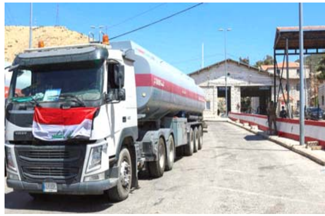
نقل: ناقلات نفط عراقية تقوم بنقل النفط الأسود الى لبنان بالنتيجة النهائية، إذ ستستقدم الشركة الفائزة بمناقصة الفيول الأسود من العراق خلال ايلول المقبل.

بغداد - الزمان بيروت - محسن حسين قررت وزارة النفط استثناء أبناء المتوفين في القطاع النفطي جراء جائحة كورونا من شروط ومعايير التشغيل بصفة اجر يومي. وقالت الوزارة في بيان تلقته (الزمان) ان (الوزارة) قررت استثناء ابناء المتوفين المتوفين بسبب كورونا من الذين تمت اصابتهم اثناء العمل من شروط ومعايير التشغيل بصفة اجر يومي، واضاف ان (قرار الاستثناء) يأتي بعد استحصال موافقة رئيس مجلس الوزراء مصطفى الكاظمي واستنادا الى الفقرة ثانيا من قرار المجلس المرقم 192 للعام الجاري، ولغت الى ان (الاستثناء) من التشغيل بصفة اجر يومي يشمل ذوي المتوفين من الدرجة الاولى (حصرا). وواصلت ملاكات هيئة المشاريع في شركة نفط ذي قار جهودها لإكمال خطة تطوير حقل الناصرية. وقال مدير هيئة المشاريع في الشركة جبار