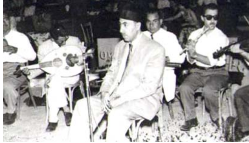
صوت: مراحل من حياة حسن خيوكة الفنية