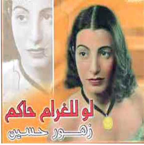
لو للفرايم حاكم زهور حسين

القاهرة - الزمان وجهت الفنانة المصرية سمية الخشاب نداء لجميع الأمهات، وذلك عبر صفحتها الخاصة على موقع التواصل الاجتماعي، بعدما تلقت العديد من التعليقات غير اللائقة على محتوى صفحتها، وعلقت الخشاب قائلة (نداء للأمهات اللي مش فاضلين لتربية اولادهم يا حلوة يالتي مشغولة ومش مسؤولة بتخلفي ليه؟ لما انتي مش قد مسؤولة تربية أطفال والأهتمام بيهم طيب ليه حضرتك تعبتي نفسك وتعيتي معاكلي المجتمع). وأضافت (على فكرة يا جماعة، البلوك سهل جداً، فركزوا قبل ما تكتبوا). وأشارت الخشاب إلى أنه لا يجب التمييز بين الفتاة الصبي، بل يجب أن يتعاونوا سوياً داخل البيت الواحد، وقالت (اللي تعلمه البيت يعمل الولد وكل واحد يتعلم يعتمد على نفسه مفيش حاجة اسمها البيت هي اللي تخدم وهي اللي تعمل، في حاجة اسمها يكون في مشاركة ومساعدة بين أفراد البيت).