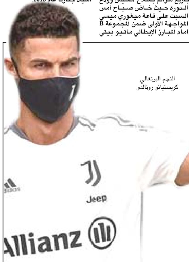
النجم البرتغالي كريستيانو رونالدو

أكدت اللجنة الطبيعية في الاتحاد العراقي لكرة القدم، انها متفائلة بمدرب المنتخب العراقي ديك أدفوكات كونه يمتلك عقلية تدريبية جيدة وله تاريخ كبير في عالم التدريب، مشيرة الى ان المدرب يقود اللاعبين حالياً بشكل احترافي كبير. وقال رئيس اللجنة اباد بينان، في تصريح صحفي انا مطمئن على مستقبل المنتخب العراقي في التصفيات الاسبوعية مع هذا المدرب الكبير ويصالح المنتخب الى كأس العالم وتحقيق الحلم، واكد ان الطبيعية لن تتدخل على ركلة جزاء بالدقيقة 10 قبل ان يعادل منتخبنا الوطني النتيجة بهدف اللاعب احمد سترين من ركلة جزاء بالدقيقة 28 قبل ان يسجل منتخب ليبيا هدفه الثاني بالدقيقة الأخيرة من عمر الشوط الاول، ليسجل البديل وكاع رمضان هدف المنتخب العراقي منتخبنا الاولبي بالدقيقة 60من ركلة جزاء، ليعود بعدها منتخب ليبيا