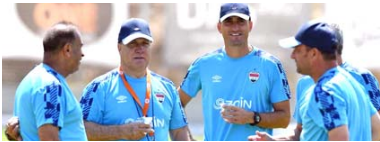
الملاك التدريبي للمنتخب الوطني

ان الاهداف الاول هو تحقيق نتيجة ايجابية على منتخبى كوريا الجنوبية وايران في مستهل مشوار المنتخب في التصفيات الحاسمة، وأوضح بينان ان المنتخب الوطني سيتوجه الى العاصمة الكورية الجنوبية سيول السبت المقبل ودية تعادل في ثلاث وفاز في واحدة.