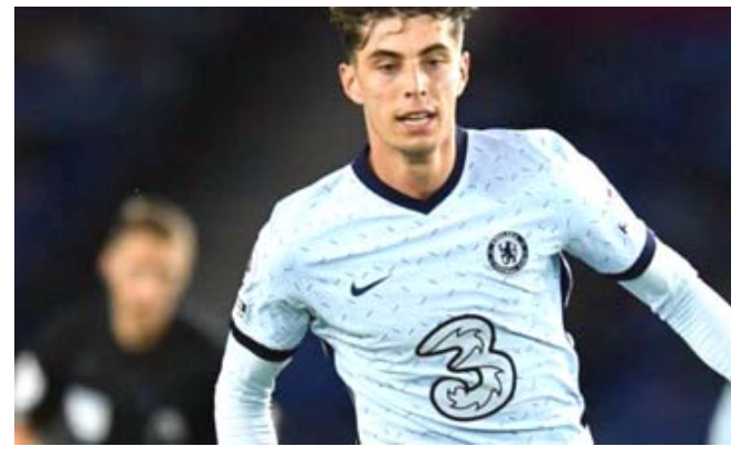
تبرع: هافيرتس يتبرع للمتضررين من الفيضانات في ألمانيا

□ لندن - (ا ف ب) - سيعرض مهاجم نادي تشيلسي الألماني كاي هافيرتس، هذه الأيام الرياضي الذي سيرتديه خلال مواجهة أرسنال الأحد في الدوري الإنكليزي الممتاز، الشاب البالغ 22 عاماً، قميصه في ولايت وايين-وستفاليا، التي يتخذ منها هافيرتس، وقال هافيرتس في تصريحات نقلتها وكالة (بي ايه) البريطانية: (صدمت عندما شاهدت اللقطات للمرة الأولى، من الصعب تخيل ما يعيشه هؤلاء الناس رائناً، لكن تعجبني على القيام بشيء ما). وتابع هافيرتس الذي سيقدم مبلغ ألف يورو للمنظمة: (أنا في 200 موقع مميز للغاية وأمل في مساعدة الصليب الأحمر الألماني من خلال إطلاق هذه الحملة، عبر تحفيز الآخرين على المشاركة)، وسيتم عرض الهدايا و قميص بقوة للتعاقد مع هذا اللاعب مع ماري كين، مهاجم توتنهام، هذا الصيف، إلا أن النادي اللندني تمسك باستمرار اللاعب هذا الموسم.