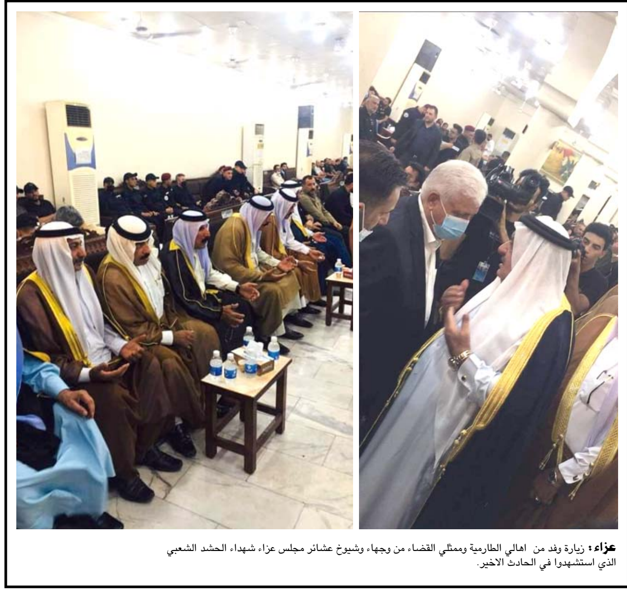
عزاء: زيارة وفد من اهالي الطارمية وممثلي القضاء من وجهاء وشيوخ عشائر مجلس عزاء شهداء الحشد الشعبي الذي استشهدوا في الحادث الأخير.