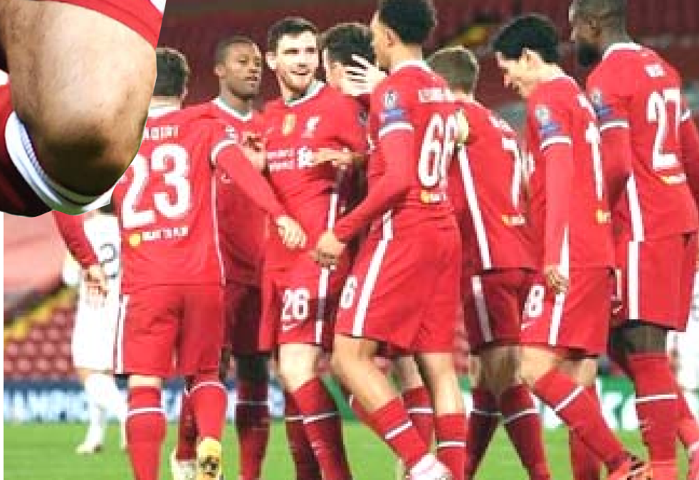
فريق : أعضاء فريق ليفربول في إحدى مبارياته

محمد صلاح في الدوري الإنكليزي الممتاز إلى 98 هدفاً ويتطلع إلى تحطيم الإيفواري ديه دروغبا هدف أفريقيا في هذه البطولة، الذي يتصدر القائمة بـ 104 هدفاً. كما توج صلاح هدافاً للدوري الإنكليزي مرتين، الأولى في موسم 2017-2018 برصيد 32 هدفاً، والثانية في نسخة التالية مباشرة بـ 22 هدفاً بالتساوي وزميله السنغالي ساديو ماني، والغابوني أوباماينغ، وانضم صلاح لصفوف الريزد في صيف عام 2017 مقابل 39 مليون يورو بعقد لخمس سنوات، ويتوقع أن يقدم النادي عقداً جديدًا لـ نجمه المصري قريباً سيجعله الأعلى أجراً في تاريخ ليفربول. وفي الفترة الأخيرة، جدد النادي عقود لاعبيه فيرجيل فان دايك، واليسون بيه، وترنت الكسندر آرنولد، ولم يقدم على أي استقدامات في المراتك الصيفي سوى المدافع الفرنسي إبراهيم كوناتي قادماً من لايبزيغ الألماني.