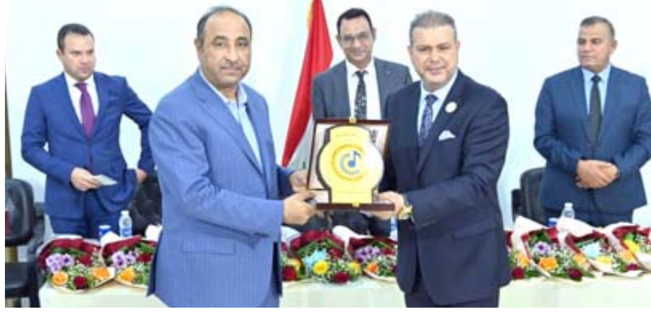
فعاليات: لحظة من فعاليات استذكار واقعة الطف وأخرى من لقاء وزير الثقافة بفرقة التراث