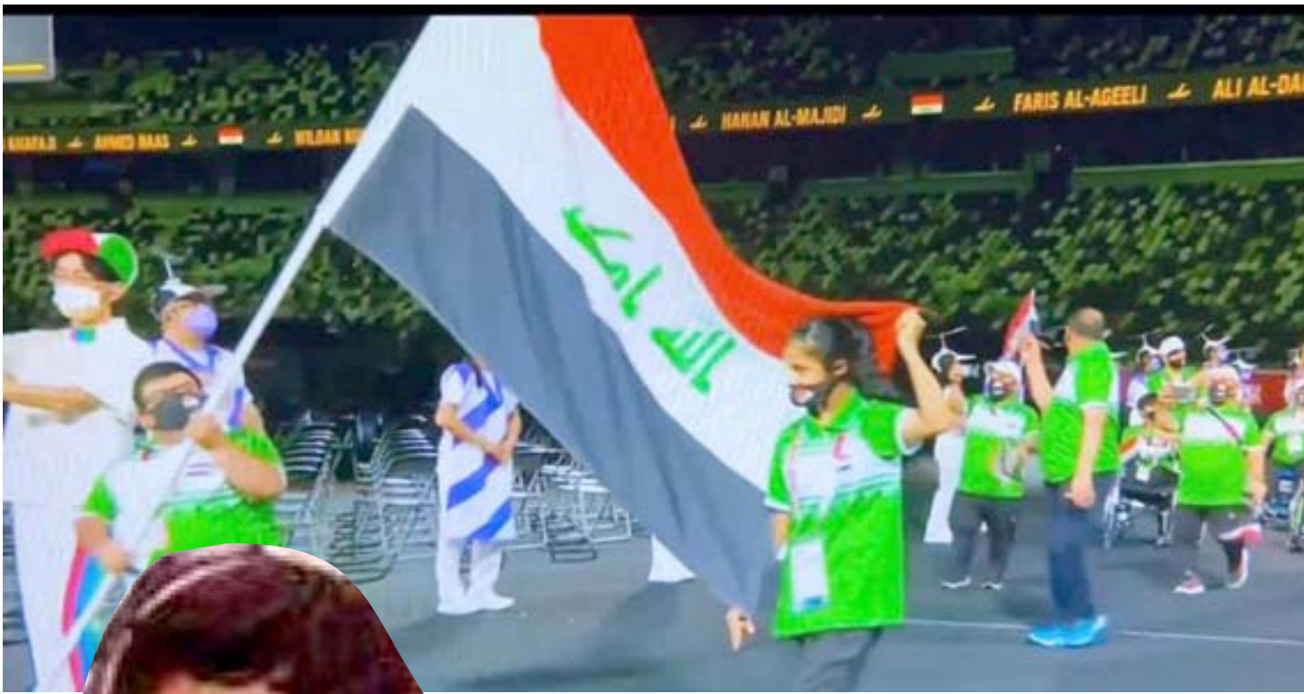
احتفال، جانب من مسير لاعبي بارلمبية العراق في افتتاح اولمبياد طوكيو