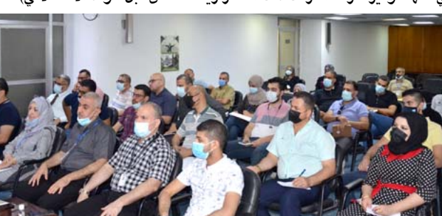
جانب من الورشة

عالية لدوائر الدولة ، بالإضافة إلى إمكانية ربطها مع بعض من خلال شبكة الانترنت مؤمنة نفذها وتديرها ملاكات الشركة . وقال بيان تلقته (الزمان) اس ان (وزارة الموارد المائية ترعب الاستفادة من هذا المشروع ، وذلك لربط مقر الوزارة مع الشركات التابعة لها في بغداد والمحافظات . حضر الورشة عدد من ممثلي الشركات العاملة في قطاع الاتصالات، الذين يدرهم طرحوا عدد من الاسئلة والاستفسارات وتمت الاجابة عليها من قبل الوفد الاتصالي.