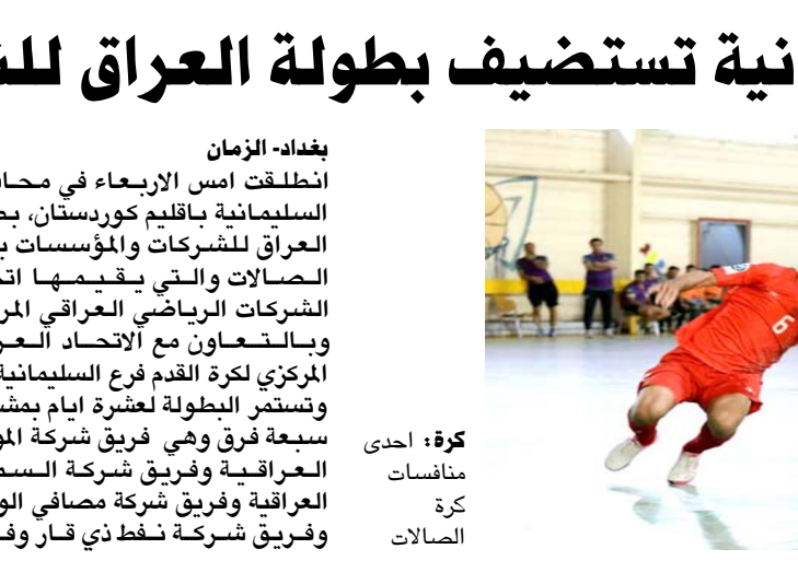
كرة: احدي منافسات كرة الصالات

بغداد- الزمان انطلقت أمس الأربعاء في محافظة السليمانية بأقليم كردستان، بطولة العراق للشركات والمؤسسات بكرة الصالات والتي يقمها اتحاد الشركات الرياضي العراقي وبالتعاون مع الاتحاد العراقي المركزي لكرة القدم فرع السليمانية. وتستمر البطولة لعشرة أيام بمشاركة سبعة فرق وهي فريق شركة الموائن العراقية وفريق شركة السمست العراقية وفريق شركة مصافي الوسط وفريق شركة نفط ذي قار وفريق